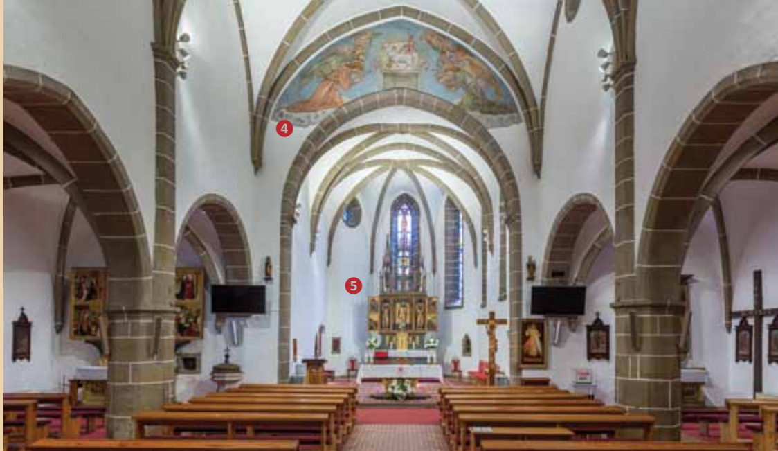
Pohľad do hlavnej lode s triumfálnym oblúkom (4) v osi kostola a Oltárom sv. Mikuláša (5) v pozadí. V bočných lodiach za mohutnými stĺpmi sa rysujú oltáre č. 2 a 6.

Prezrite si skvosty najstaršej stavebnej pamiatky mesta – najväčšej ranogotickej stavby Liptova! Postavený bol ako farský kostol pre 5 neďalekých osád. Spočiatku stál osamotený uprostred krajiny, postupne sa okolo neho rozrastalo mestečko Svätý Mikuláš. Táto impozantná sakrálna stavba stojí na mieste staršieho románskeho kostolíka z 11. – 12. storočia, ktorý pri výstavbe jednoloďového kostola v rokoch 1280 – 1300 prevzal úlohu sakristie a je najstaršou časťou súčasného chrámu. V polovici 15. storočia bol kostol rozšírený a zaklenutý, veža bola nadstavaná a upravená v neskorogotickom slohu. V tom období kostol spolu s neďalekou Pongráčovskou kúriou opevnili a obohnali vodnou priekopou; neskôr prešiel barokovou prestavbou. Vo svojej ranogotickej podobe sa chrám opäť zaskvel po rozsiahlej rekonštrukcii v rokoch 1941 – 43, kedy odstránili opevňovací múr a pristavali bočné kaplnky. Následne v celom kostole osadili nádherné vitrážové okná.