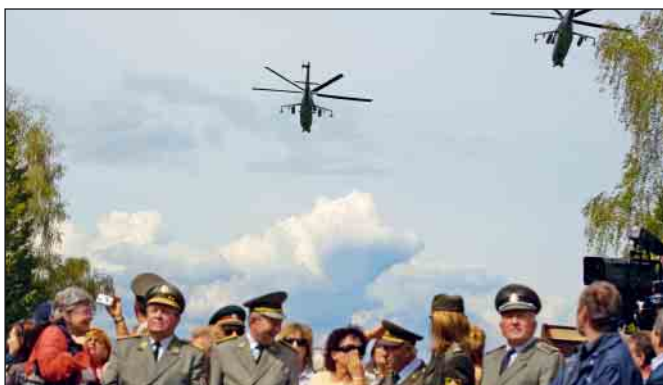
Slávnosti sa začali preletom bojových vrtuľníkov EMI 24 a stíhacích lietadiel MIG 29.