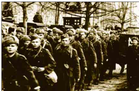
Príslušníci 1. čs. armádneho zboru prechádzajú okolo budovy gymnázia, 4. apríla 1945.

Druhú etapu – od 15. februára do 3. marca – ovplyvnilo okrem iného aj tempo operácií Červenej armády v južnom Poľsku, ktoré sa výrazne spomalilo v dôsledku silného odporu nemeckých vojsk, pričom sovietske jednotky dosahovali iba miestne úspechy. Nemecké velenie na