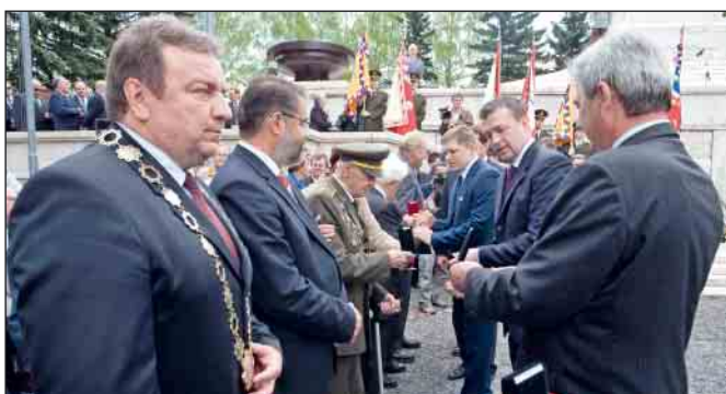
Rozkaz ministra obrany SR uviedol oceňovanie vojnových veteránov a štyroch slovenských miest, ktoré sa významne zapísali do histórie protifašistického odboja.