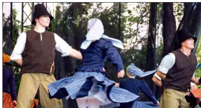
Poddukeľský umelecký ľudový súbor uviedol na Námestí osloboditeľov celosúborový program Očarení pohľadom. Pri príležitosti osláv navštívili mesto aj členovia dychového orchestra z poľského Jasla.