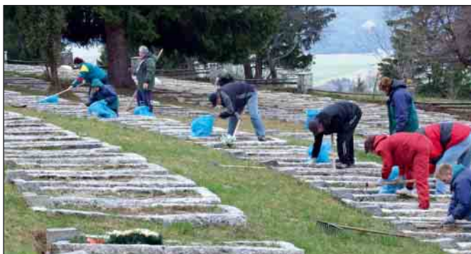
Háj Nicovô pripravovali na slávnosti dôchodcovia z 9 klubov seniorov. Čistením a upratovaním strávili dobrovoľníci na cintoríne stovky brigádnických hodín.