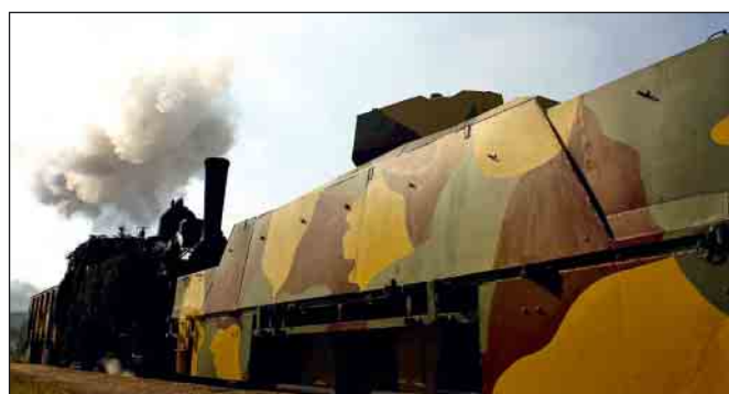
Oživený pancierový improvizovaný povstalecký vlak Štefánik na železničnej stanici v L. Mikuláši priniesol neočakávaný úspech, navštívili ho tisíce ľudí.