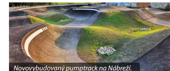
Novovybudovaný pumptrack na Nábřeží.

Doplnil, že po dlhých rokoch žiadostí a interpelácií sa župa konečne odhodlala k rekonštrukcii Vrbického mosta a eurofondové peniaze v objeme 20 miliónov eur skvalitňujú infraštruktúru v areáli miestnej Akadémie ozbrojených síl.