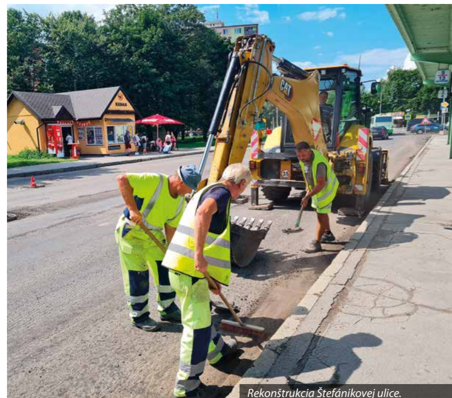
Rekonštrukcia Štefánikovej ulice.