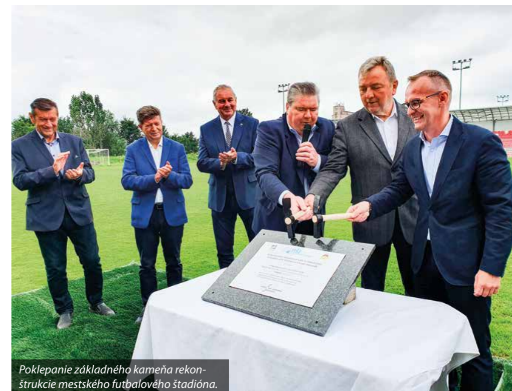
Poklepanie základného kameňa rekonštrukcie mestského futbalového štadióna.

„Nezabúdame ani na športovcov, okrem centrálnej investície do futbalového štadióna, pribudla nová umelá tráva na vedľajšej ploche, pri Váhu vyrástol pumptrackový areál, na plavárni vymeníme strechu. Finalizujeme rekonštrukciu detských jaslí a v oblasti školstva a sociálnych vecí pripravujeme pro-