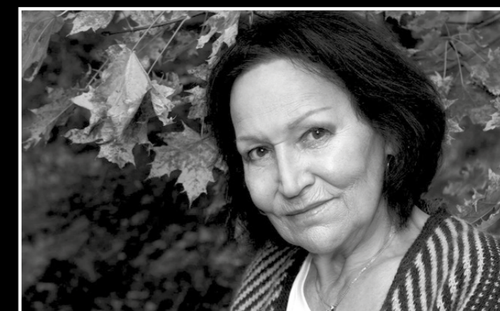
MARTA KUBIŠOVÁ (CZ)