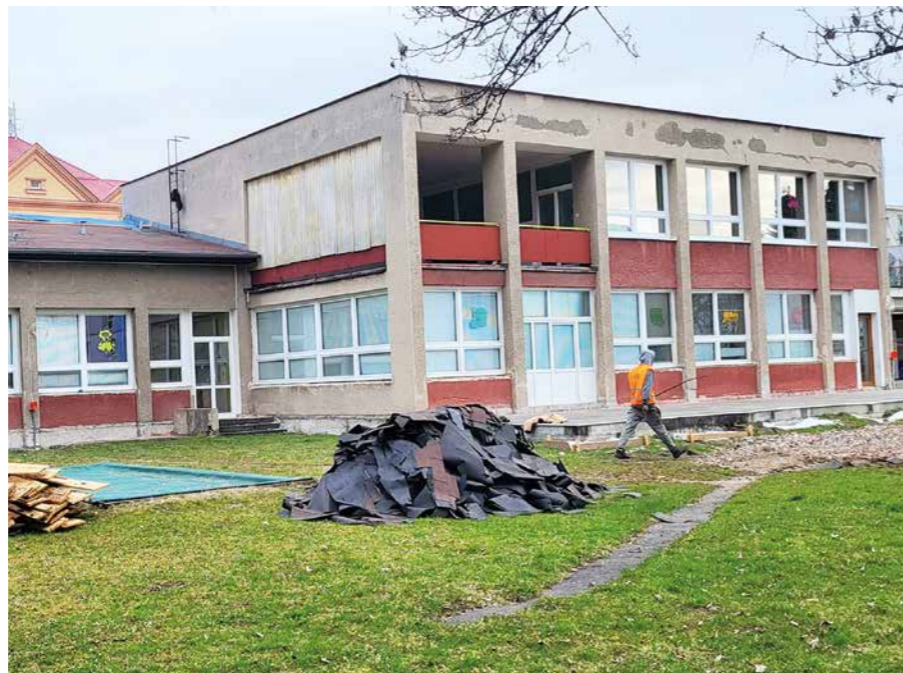
V detských jaslách Mikulášik naplno pracujú robotníci

Už vyše mesiaca počť z priestorov detských jaslí na Komenského ulici miesto džavotu stavebný ruch. Mesto spustilo očakávanú rekonštrukciu päťdesiatročného objektu, peniaze na rozsiahlu modernizáciu získala radnica z envirofondu. Všetky práce prispejú nielen k väčšiemu komfortu detí a zamestnancov, v čase zdražovania energií bude po realizácii benefitom zníženie energetickej náročnosti objektu.