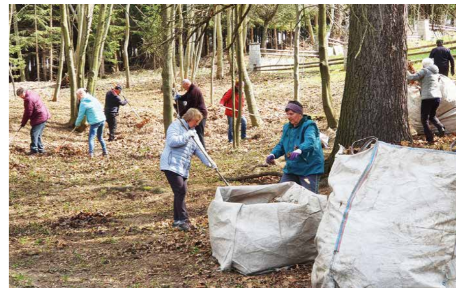
Z upratovania Hája sa stala už tradícia, odpadu ubúda

Do mestskej akcie Upracme si Háj sa koncom apríla zapojilo vyše dvesto ľudí. Svojou pracovitosťou a odhodlaním prispeli k skrášleniu prostredia, ktoré je symbolom piety, ale aj priestorom pre oddych a športové aktivity. So zápalom sa na čistení podieľali viacerí žiaci zo všetkých mestských základných škôl, upratovali aj zamestnanci mestského úradu, členovia klubov seniorov aj klienti domovov