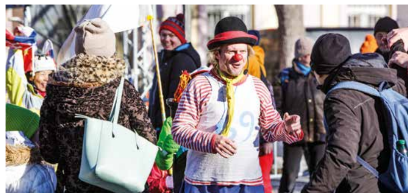
|| Súčasťou programu v Petinej fanzóne bolo aj vystúpenie Teátru komika pre rodiny s deťmi.