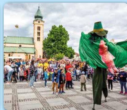
Máj: Deň rodiny