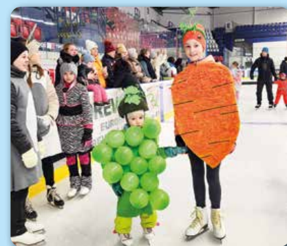
Február: Karneval na ľade