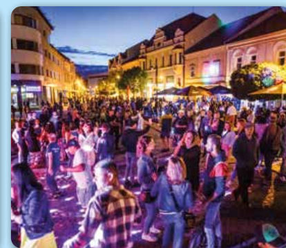
August: Street music night