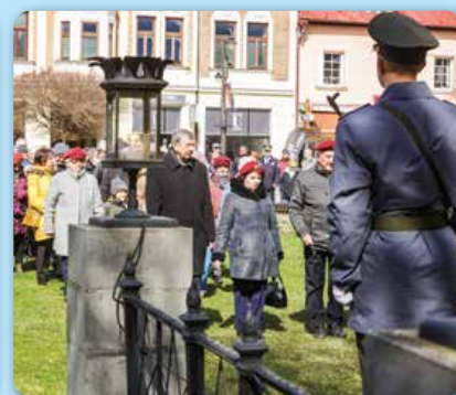
Apríl: Oslavy oslobodenia