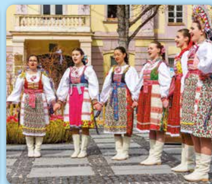
Marec: Veľká noc v meste