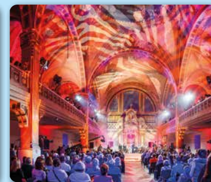
September: Mosty Gesharim