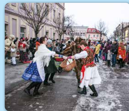
Február: Fašiangy v meste