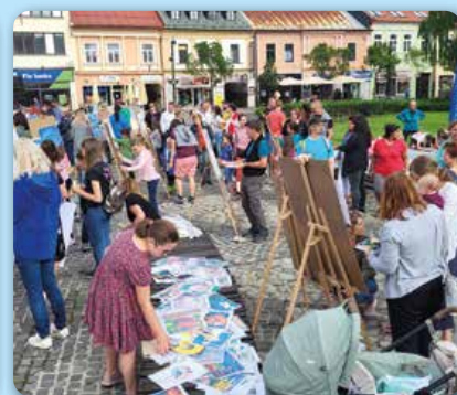
Jún – júl: Mikulášske leto