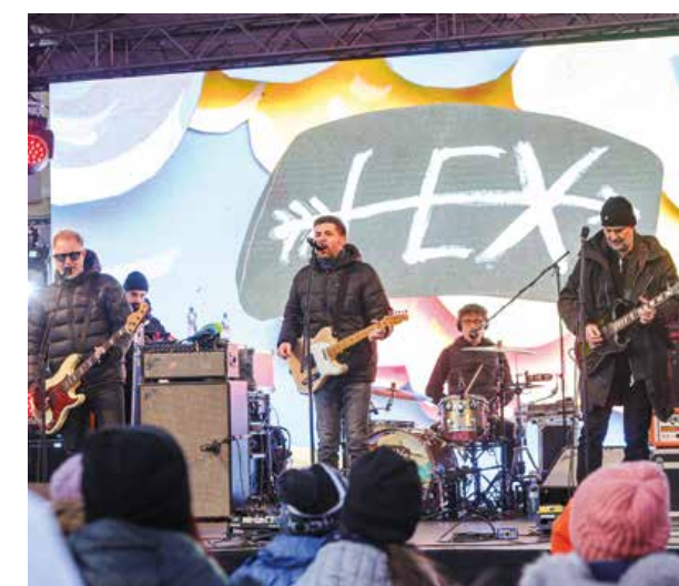
|| Program fanóny na námestí bol nabitý, vystúpila aj kapela HEX.