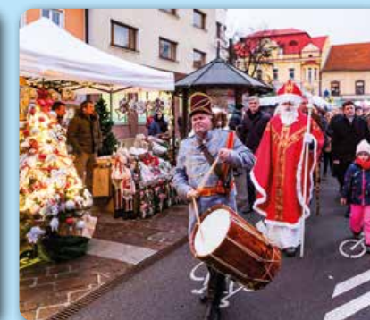
December: Mikulášsky jarmok