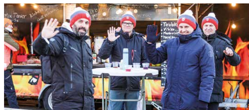
|| Fanúšikovia v centre Liptovského Mikuláša súťažili o rôzne suveníry, v hre boli aj tri knihy o Petre Vlhovej s jej vlastnoručným podpisom.

tovecký Mikuláš, Petra Vlhová na domácom kopci nedokončila preteky, v prvom kole sobotňajšieho obrovského slalomu po niekoľkých brámkach spadla, zo zjazdovky ju záchranári zviezli na saniach a následne transportovali vrtuľníkom na vyšetrenie do ružomerskej nemocnice. Po jej páde síce námestie stíchlo, keď sa však roznesla správa, že Peťa bude v poriadku, ľudia začali opätovne skandovať jej meno. Pokrik však už neznamenal „vyhrať“, fanúšikovia už Peti posielali hlasný odkaz, že jej držia palce, nech sa uzdraví.