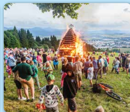
Júl: Vatra zvrchovanosti