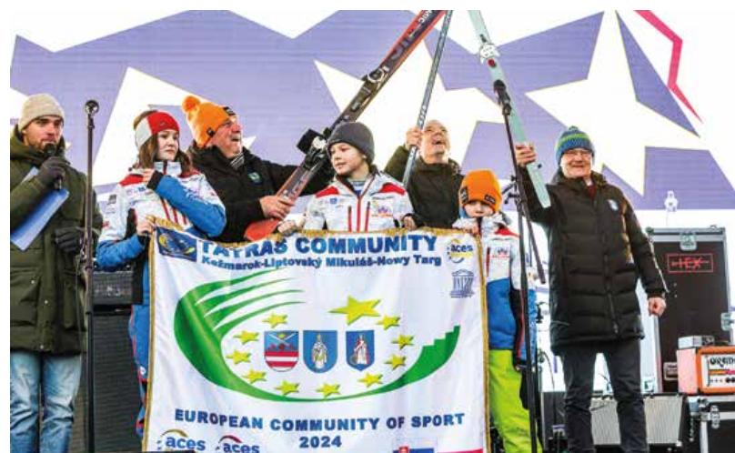
|| Európsku komunitu športu uviedli do života zástupcovia miest Liptovský Mikuláš, Kežmarok a Nový Targ práve vo fanzóne na námestí.