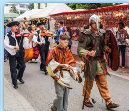
Jún: Stoličné dni