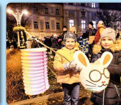
November: Lampiónový sprievod