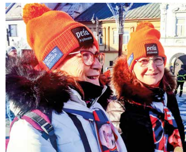
|| Petine oranžové čiapky sa dali kúpiť v stánku so suvenírmi.