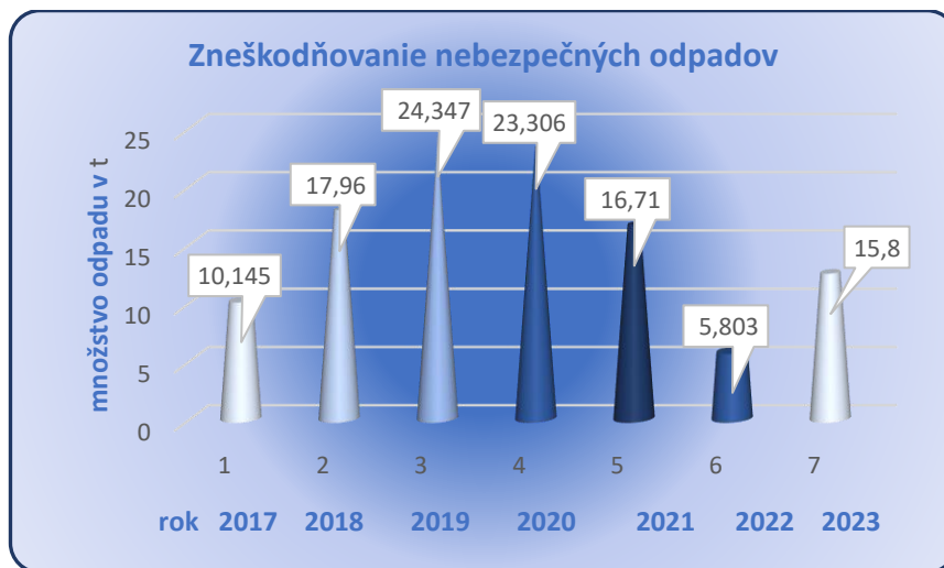
Graf č. 4: