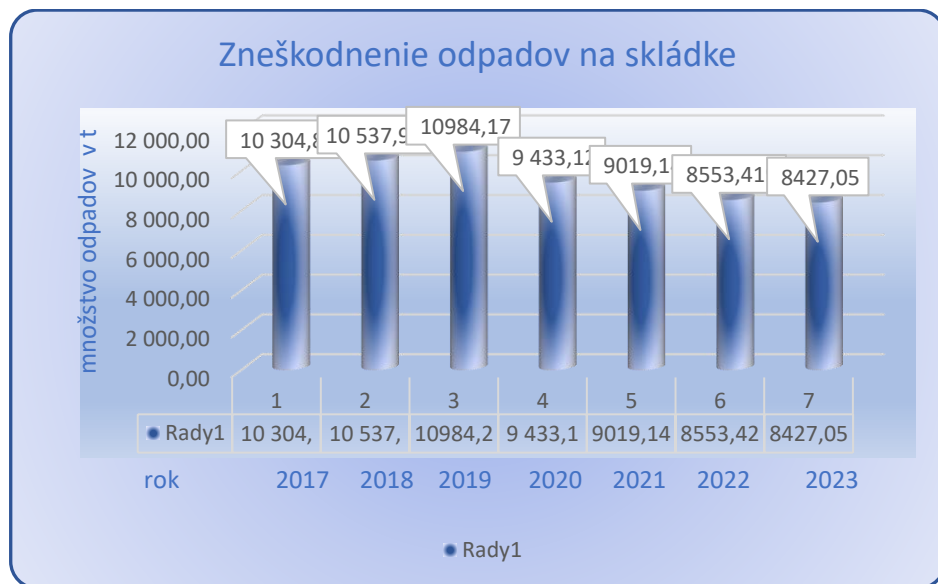
Graf č. 3

*Hodnoty prevzaté z fakturačných dokladov prevádzkovateľa skládky v súlade s vyhláškou č. 366/2015 Z. z.