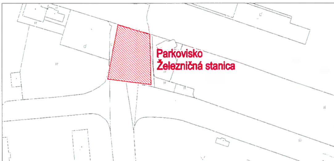
Príloha č.1 k VZN č. 2/2014/VZN