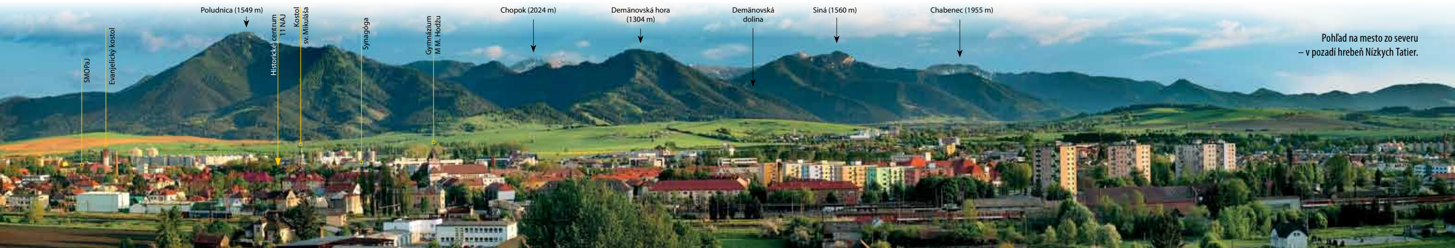
Pohľad na mesto zo severu – v pozadí hrebeň Nízkych Tatier.

Pri prehliadke múzea, ktoré sa jedinečnosťou svojho zamerania vyrovná moderným svetovým múzeám, čaká návštevníkov množstvo zážitkov – môžu tu zažiť aj atmosféru vzniku Zeme, ale tiež ujasniť si svoj vlastný postoj k životnému prostrediu.