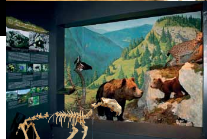
Pohľad do interaktívnych expozícií múzea: 1. Hory, človek, NATURA 2000, 2. Zem, miesto pre život. Vlavo: Model kostry jaskynného leva.

Pri prehliadke múzea, ktoré sa jedinečnosťou svojho zamerania vyrovná moderným svetovým múzeám, čaká návštevníkov množstvo zážitkov – môžu tu zažiť aj atmosféru vzniku Zeme, ale tiež ujasniť si svoj vlastný postoj k životnému prostrediu.