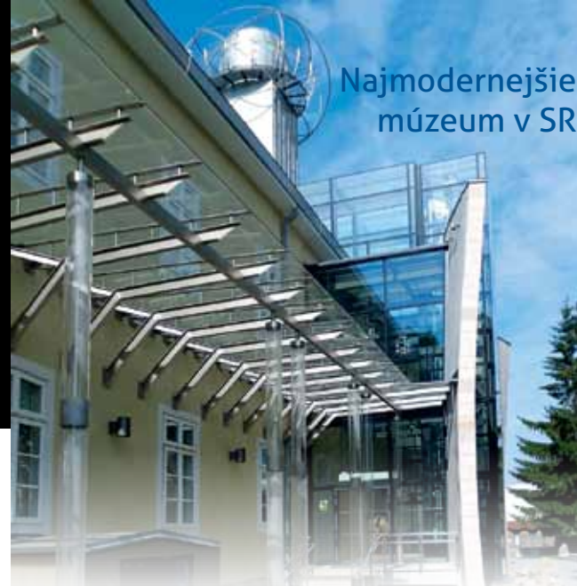
Najmodernejšie múzeum v SR