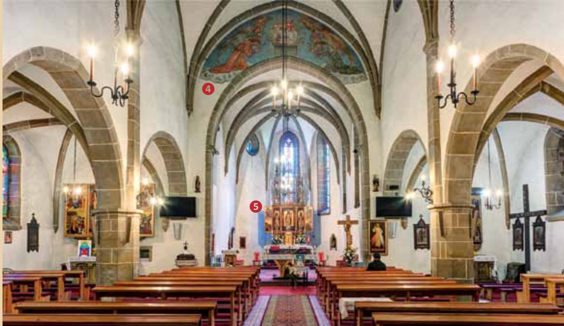
Pohľad do hlavnej lode s triumfálnym oblúkom (4) v osi kostola a Oltárom sv. Mikuláša (5) v pozadí. V bočných lodiach za mohutnými stĺpmi sa rysujú oltáre č. 2 a 6.

Prezrite si skvosty najstaršej stavebnej pamiatky mesta – najväčšej ranogotickej stavby Liptova! Postavený bol ako farský kostol pre 5 neďalekých osád. Spočiatku stál osamotený uprostred krajiny, postupne sa okolo neho rozrastalo mestečko Svätý Mikuláš. Táto imponantná sakrálna stavba stojí na mieste staršieho románskeho kostolíka z 11. – 12. storočia, ktorý pri výstavbe jednododového kostola v rokoch 1280 – 1300 prevzal úlohu sakristie a je najstaršou časťou súčasného chrámu. V polovici 15. storočia bol kostol rozšírený a zaklenutý, veža bola nadstavovaná a upravená v neskorogotickom slohu. V tom období kostol spolu s neďalekou Pongráčovskou kúriou opevnili a obohnali vodnou priekopou; neskôr prešiel barokovou prestavbou. Vo svojej ranogotickej podobe sa chrám opäť zaskvel po rozsiahlej rekonštrukcii v rokoch 1941 – 43, kedy odstránili opevňovací múr a pristavali bočné kaplnky. Následne v celom kostole osadili nádherné vitrážové okná.