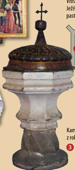
Kamenná krstiteľnica z roku 1490.