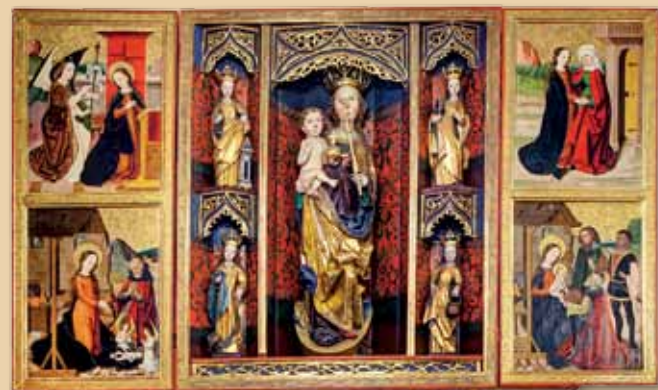
Oltár Panny Márie z 15. storočia.