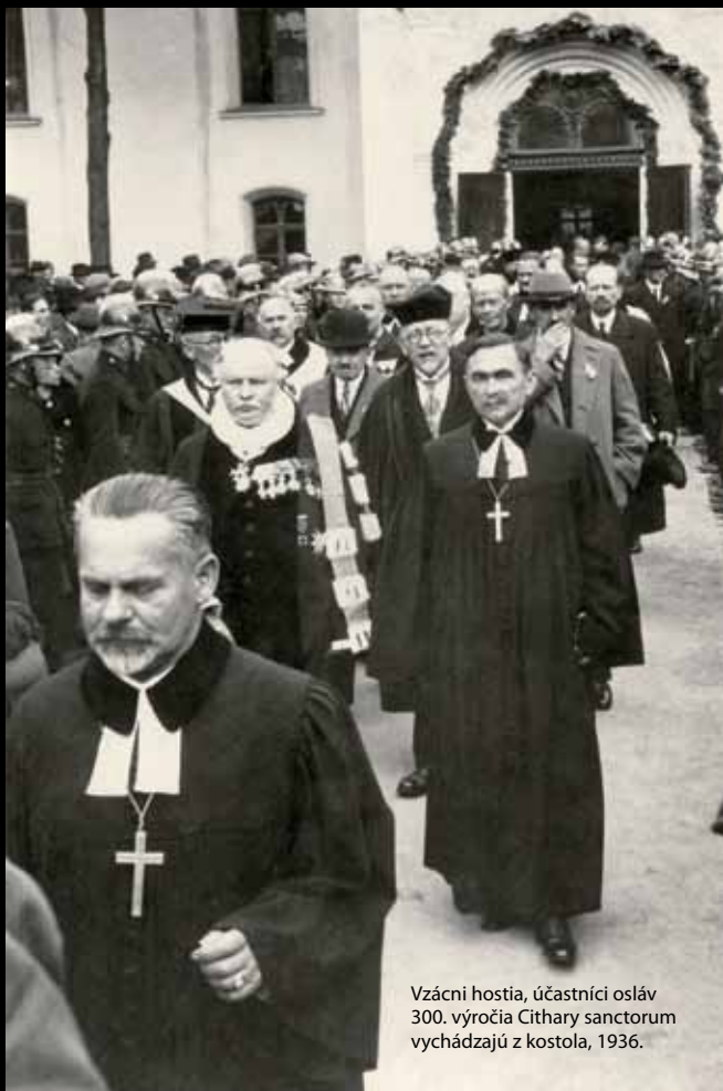
Vzácní hostia, účastníci osláv 300. výročia Cithary sanctorum vychádzajú z kostola, 1936.