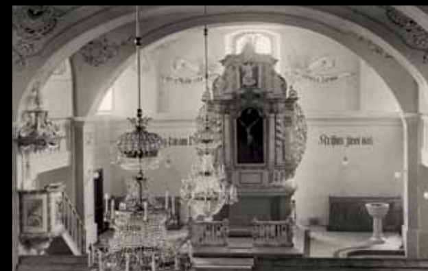
Fotografia z roku 1935.